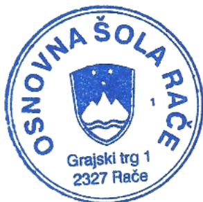
Ravnatelj: Rolando Lašič