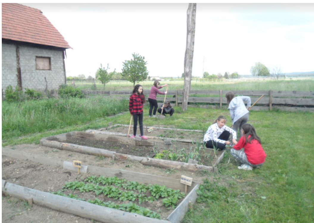
Učiteljica začetnica se je z učenci nekajkrat podala na šolski vrt in tam organizirala različne dejavnosti.