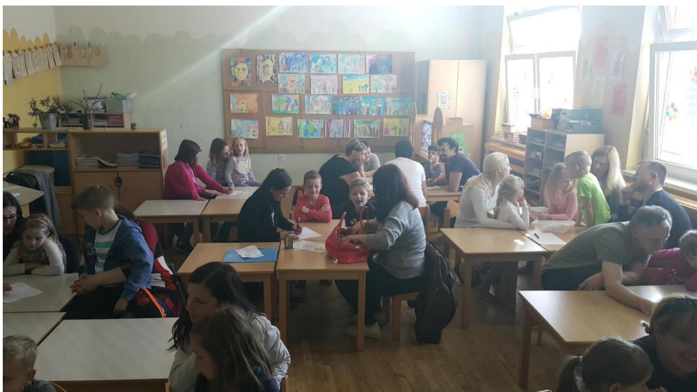
Učiteljica začetnica je pripravila in izvedla roditeljski sestanek na temo 8 krogov odličnosti.